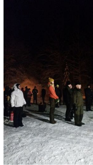
Tunnelmia "Kylät yhdessä – Suomi 100" -tapahtumasta.