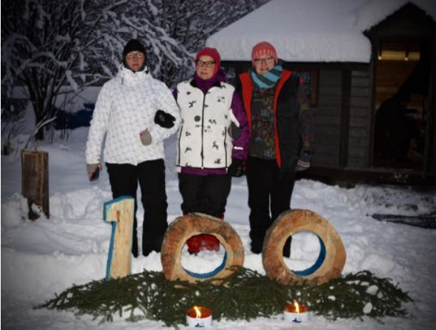
Varpasalon Martat olivat huolehtimassa yleisön kahvituksesta.