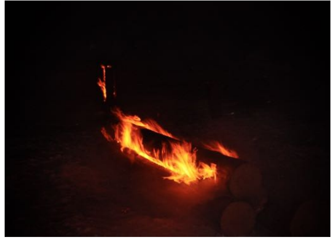
Rakovalkeat ja jätkänkynttilät valaisivat lumisen maiseman.