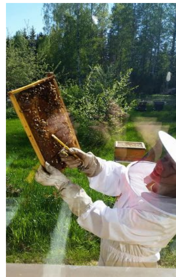
Avoimet Kylät -tapahtuman tunnelmia Salpapolulla ja mehiläistarhalla