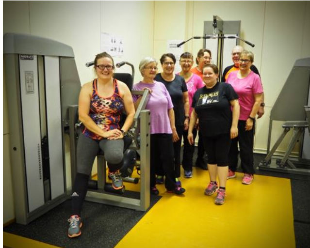
Kuntosalikerholaisia Varpasalon kylätalolla